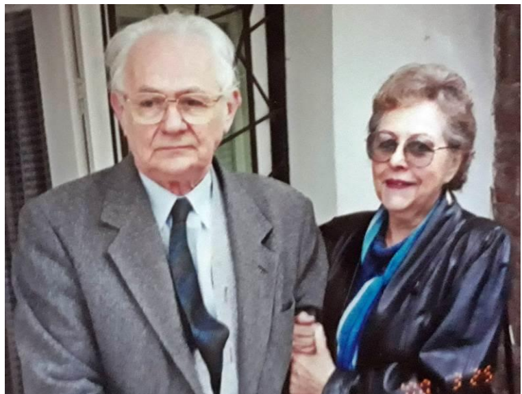
Doktor úr gyógyszerész feleségével, aki ehhez az életúthoz 60 éven át támogató háttér volt.