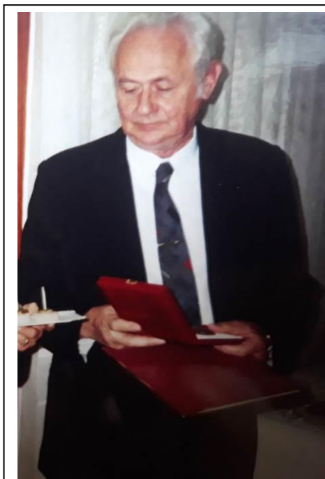
Battyány-Strattmann díjas orvos