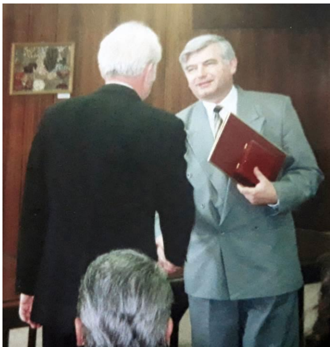
Díj átvétel - 1994